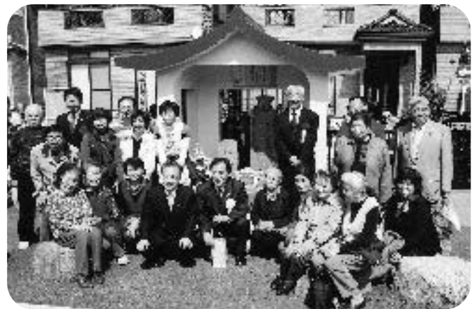
「藤工門川の再生完成式にて」芝刈町会の方々と