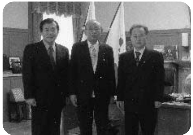
永瀬先生と知事表敬訪問