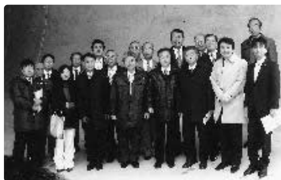
ハツ場ダム視察 川原畑地区仮排水トンネルで自民党川口市議団と