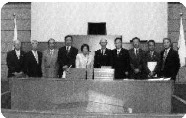
領家地区の方々の県議会議事堂視察