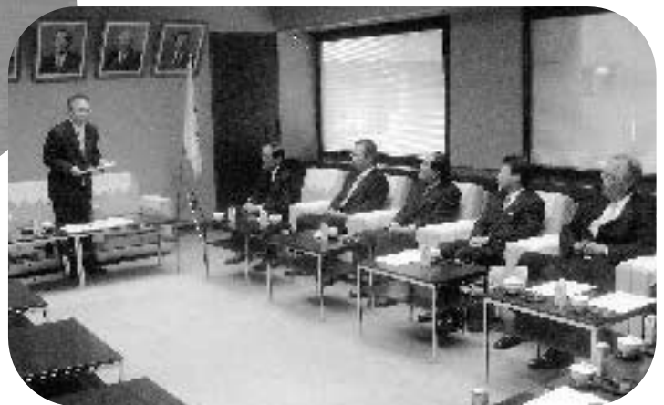
埼玉県市長会の要望に応える奥ノ木議長