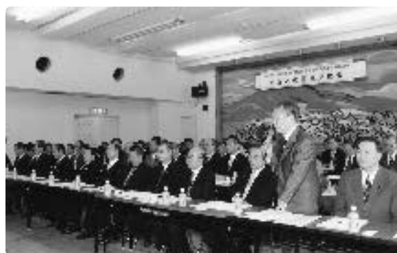
ハツ場ダム建設推進埼玉県議員連盟 地元との意見交換会にて