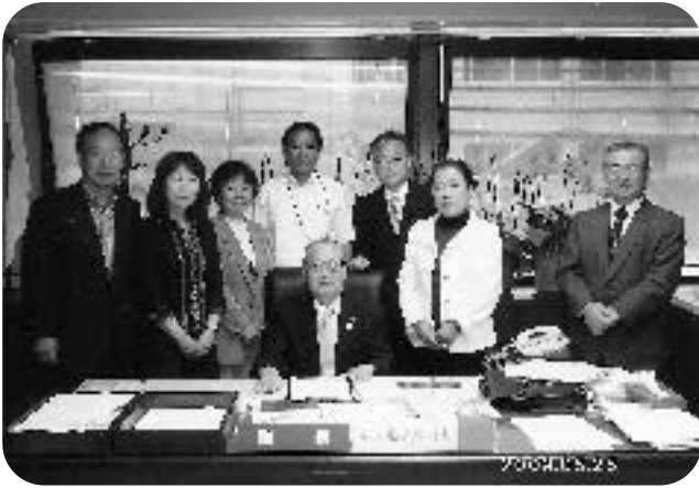
上青木地区の方々と