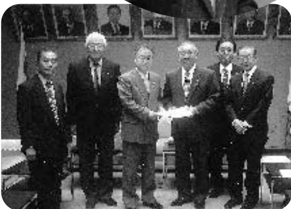
埼玉県町村長会の要望に応える奥ノ木議長