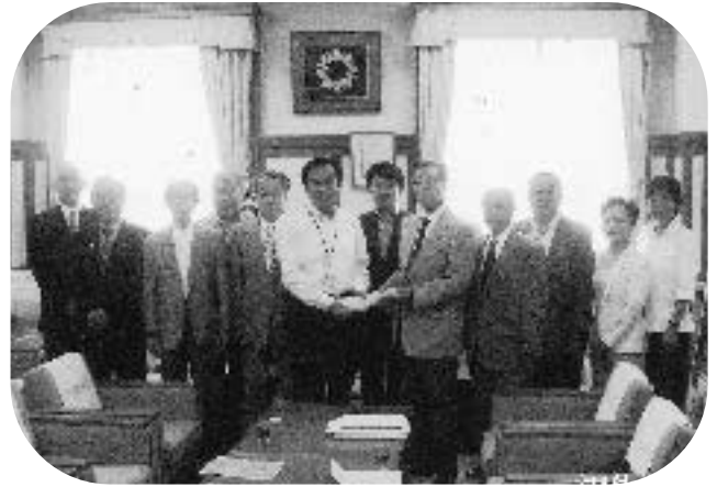
新郷地区の要望を上田知事に届ける